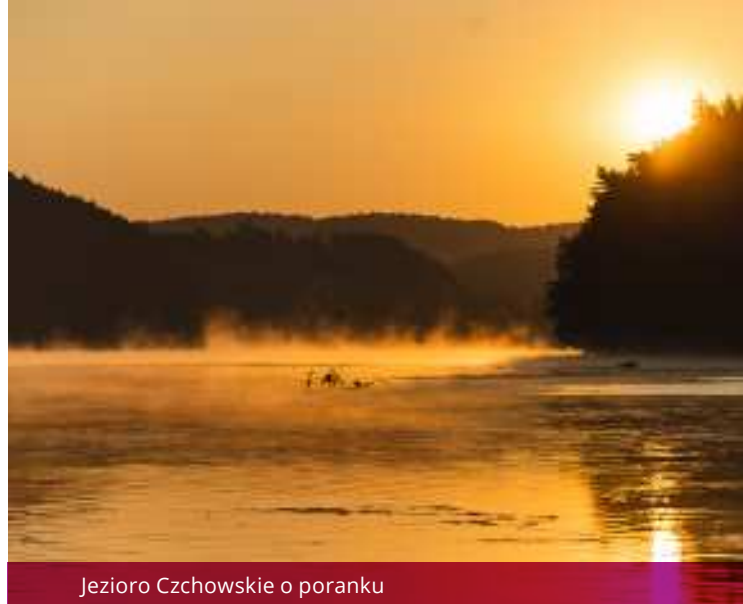
Jeziro Czchowskie o poranku