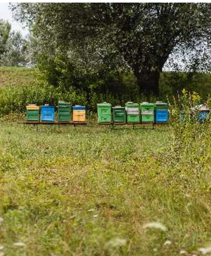
Pasieki w Dolinie Dunajca