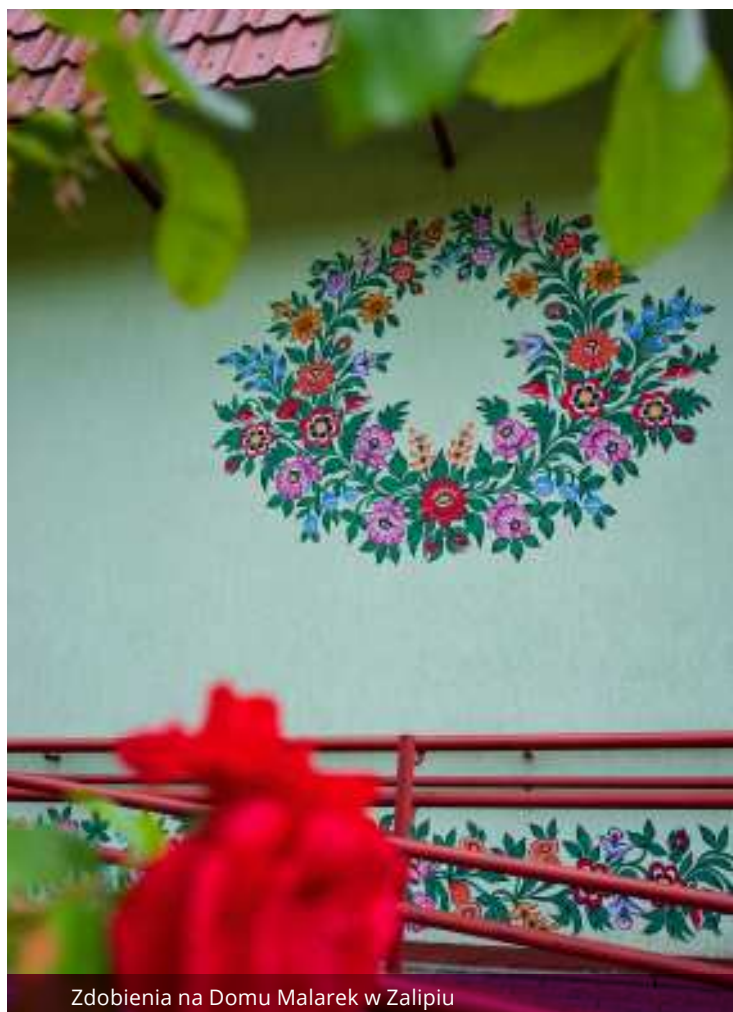
Zdobienia na Domu Malarek w Zalipiu

Promy bezpłatne, czynne cały rok, także w święta. Nieczynne w okresach wysokiego poziomu wody w rzece oraz pokrywy lodowej lub kry.