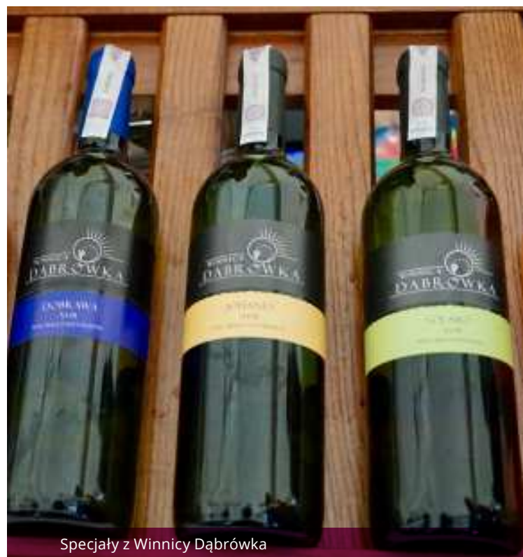
Specjały z Winnicy Dąbrówka

Gospodarstwo Agroturystyczne Lanckoronka , Zawada Lanckorońska 35, tel. +48 14 665 37 45, www.lanckoronka.pl