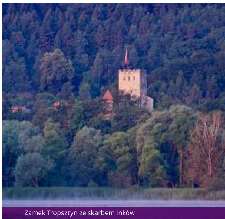
Zamek Tropsztyn ze skarbem Inków