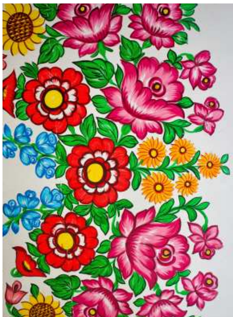
Ręcznie malowane zdobienia zalipiańskich zagród