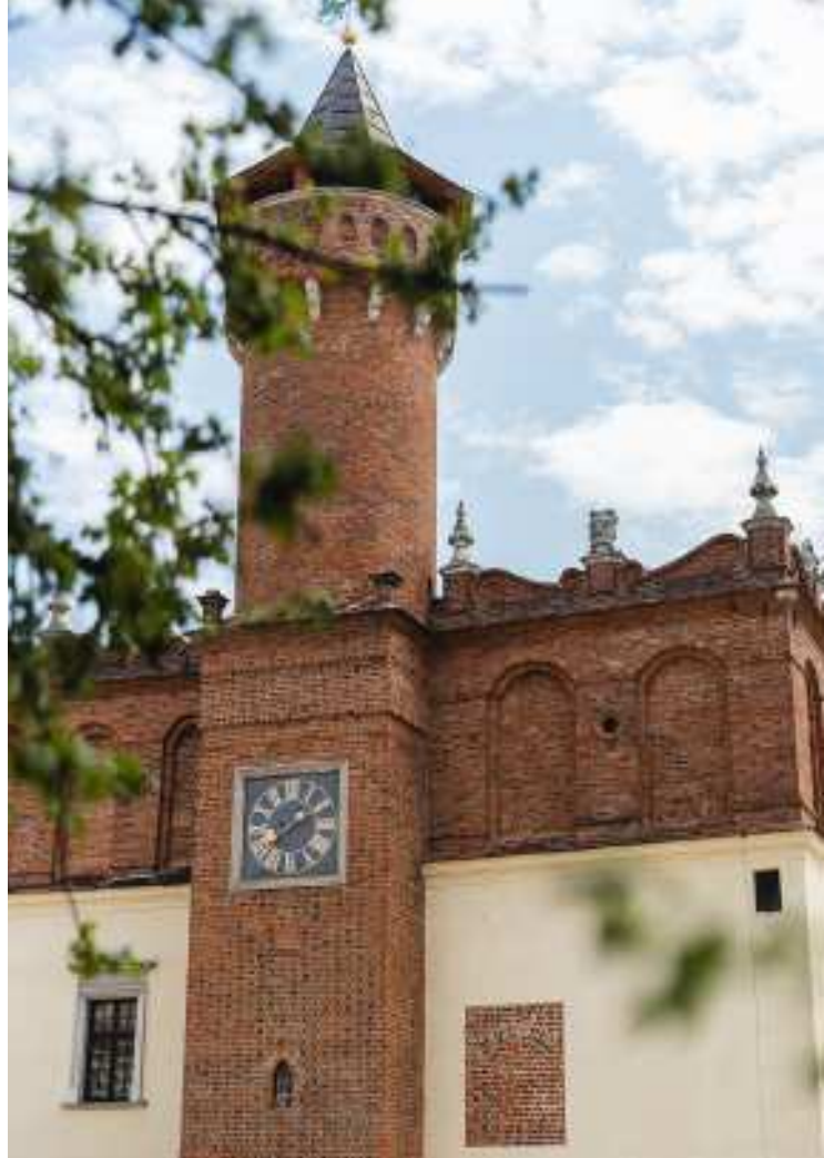
Słynny renesansowy Ratusz w Tarnowie

Ozdobą tarnowskiego Starego Miasta są renesansowe kamienice. W neogotyckiej Bazylice Katedralnej Narodzenia Najświętszej Marii Panny (pierwotnie był to gotycki kościół przebudowany pod koniec XIX w.) znajduje się zespół reprezentacyjnych (najwyższych w Europie) nagrobków rodzin Tarnowskich i Ostrogskich autorstwa Jana Marii Padovana. Nagrobek Barbary z Tęczyńskich Tarnowskiej, zmarłej młodo pierwszej żony hetmana Jana Amora Tarnowskiego, wykonany przez Bartolomea Berecciego, zalicza się do najpiękniejszych renesansowych pomników kobiecych w Europie.