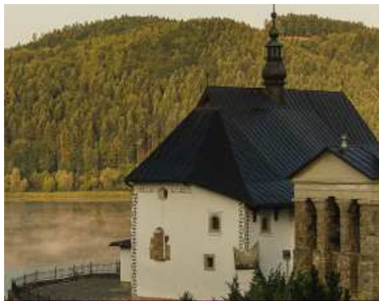
Romański kościół w Tropiu