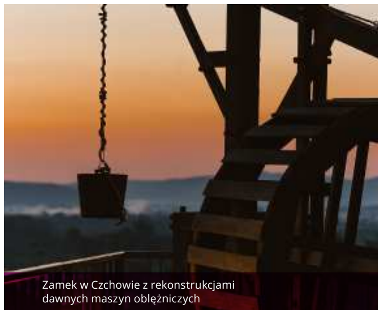
Zamek w Czchowie z rekonstrukcjami dawnych maszyn oblężniczych