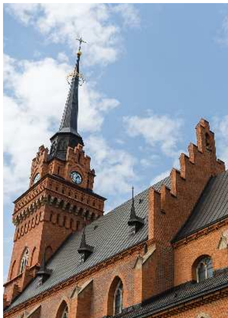
Bazylika Katedralna w Tarnowie