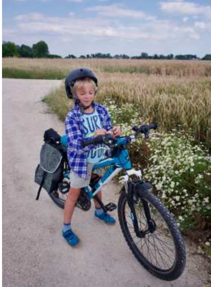
Wjeżdżamy na Wiślaną Trasę Rowerową

VeloDunajec na odcinku Ostrów k. Tarnowa – Wietrzychowice (ok. 28 km) jest gotową trasą rowerową odseparowaną od ruchu kołowego. Zaawansowani cykliści mogą wyruszyć do Zalipia ze stacji kolejowej Bogumiłowice k. Tarnowa – przejechać stąd trasą VeloDunajec do Pasieki Otfinowskiej, tu promem przepłynąć na drugą stronę Dunajca i dalej Bursztynowym Szlakiem Greenways dotrzeć do Zalipia. Taka wycieczka w jedną stronę liczy ok. 34,5 km. Po drodze czeka na nas wiele historycznych ciekawostek i miejsc pamięci, takich jak Pomnik Bohaterów Września 1939 r. w Biskupicach Radłowskich upamiętniający żołnierzy poległych w obronie mostu na Dunajcu. Znajdują się tu także cmentarze z I wojny światowej oraz gotycki kamienny stół graniczny z XV w. będący pamiątką po sporze o lasy radłowskie pomiędzy właścicielami wsi rycerskiej Zabawa a biskupami krakowskimi.