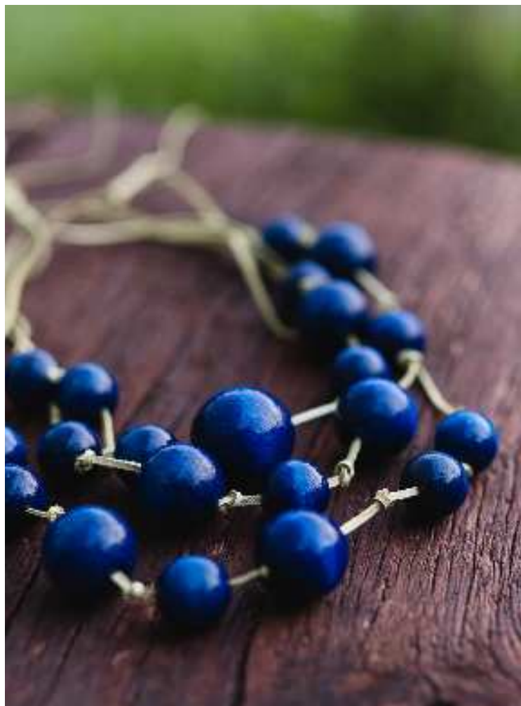
Drewniane korale z Tarnowa przypominające owoce tarniny