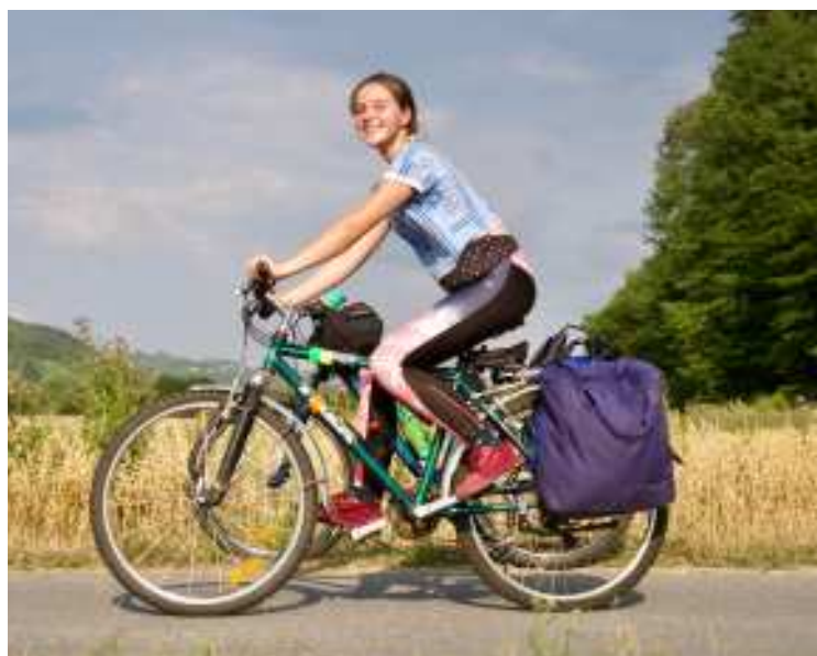
Rowerem w Dolinie Dunajca