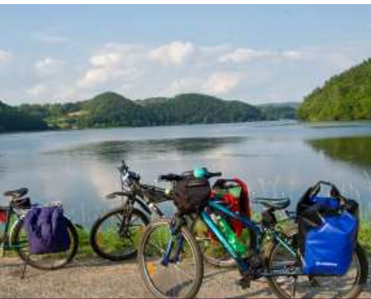
Widok na Jezioro Czchowskie