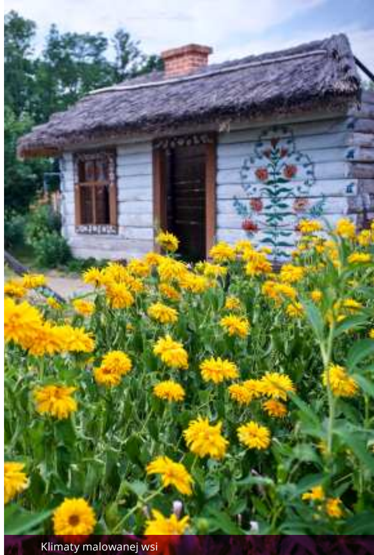
Klimaty malowanej wsi