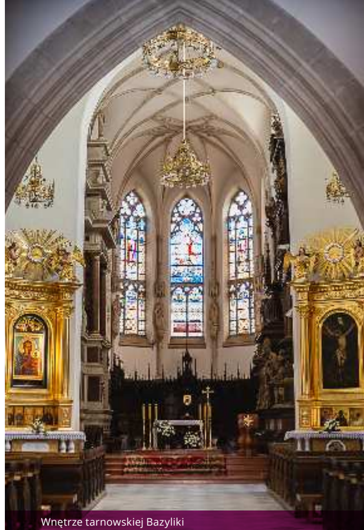
Wnętrze tarnowskiej Bazyliki